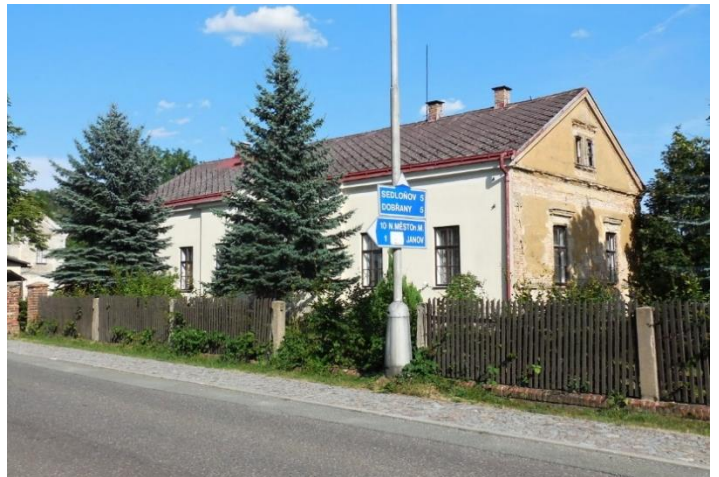
Bysterská fara (červenec 2019)