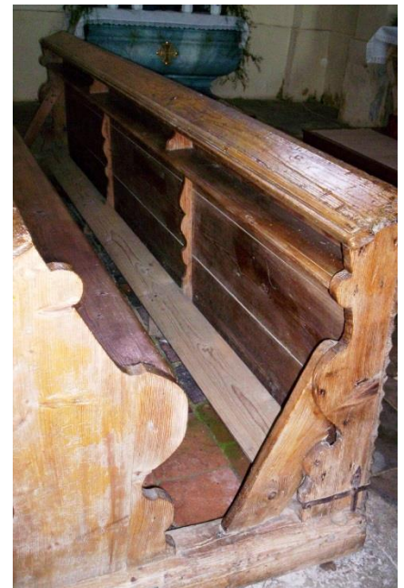
Lavice v bysterském kostele

Na závěr: je něco, co Vás osobně zaujalo na bysterském kostele?