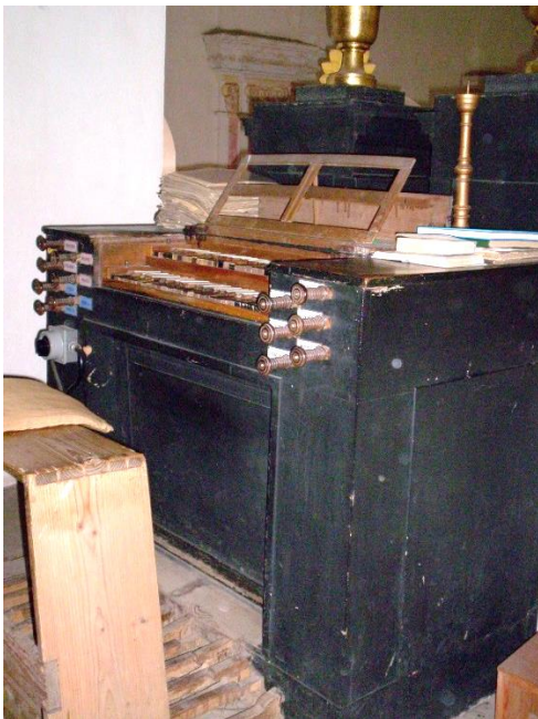
Varhany před údržbou

Na varhany se vybíraly peníze při koncertech už delší dobu, třeba i při ekumenické bohoslužbě. Teď konečně jsme je využili na důkladnou údržbu – zaplatilo se přes sto tisíc korun. Varhany mají nový motor, novou klaviaturu, vzdušnice byly opraveny a vyčištěny. Po dobu, kdy byl přístroj mimo provoz, jsme využívali harmonium z fary. Motor je silnější, i pro varhaníka je to komfortnější. Zvuk jde těžko nějak popsat – nejlepší je, když si přijdete varhany poslechnout přímo do kostela.