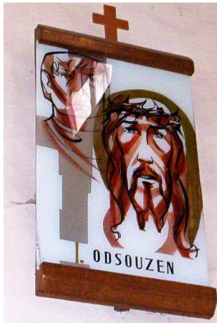
První zastavení křížové cesty